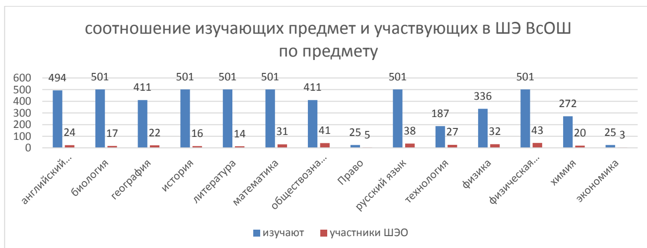
Таблица 2 - Итоги ШЭ ВсОШ за 3 года

На диаграмме к Таблице 1 представлены данные, показывающие соотношение изучающих по школе данный учебный предмет, к количеству участников ШЭ ВсОШ по предмету. Очень малочисленными и практически безрезультатными прошли Олимпиады по биологии, истории, литературе.